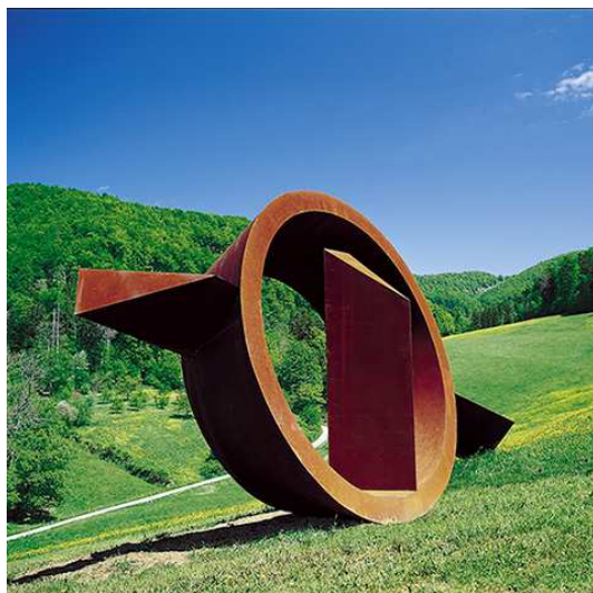
Skulptur von Ben Jakober, Mallorca, „El Triunfo de la Razon“, 1979 Stein in Eisenkabinet